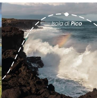
Isola di Pico