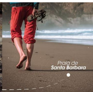
Pratia de Santa Barbara

con la direzione tecnica di EQUIPAGE TOUR – Agenzia viaggi di Genova