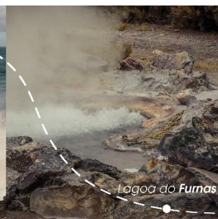
Lagoa do Furnas